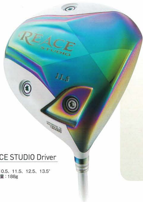
REACE STUDIO Driver SPAC ロフト: 10.5、11.5、12.5、13.5° ヘッド重量: 188g