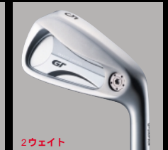
2ウェイト GRAVITY CONTROL IRON 番手 4I-9I・PW