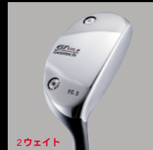
2ウェイト UTILITY 番手 U2・U3・U4・U5