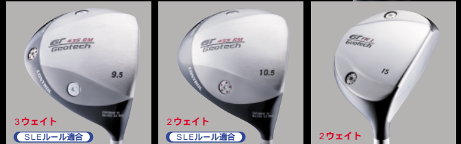
3ウェイト SLEルール適合 435 RM DRIVER ( レンチ付属 ) ロフト 9.5度・10.5度